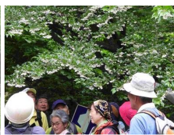
森のシャンデリア（エゴノキ）