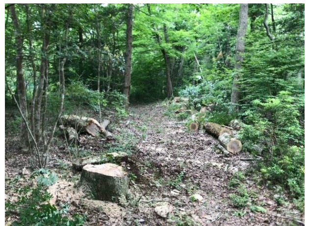
伐採した散策路沿いの枯損木

安全作業の観点からも、事前に計画を立て、それに沿って無理なく進めていくのが肝要です。ご安全に！（竹下）