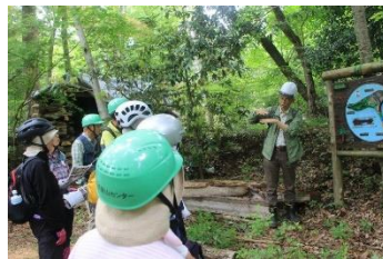
川回しにより島ができた話