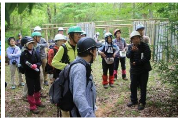
物置の設計について説明