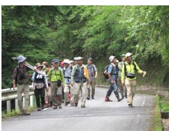
鳥の声を聴きながらハイキング

この原稿を書いている時点では窓の外に雨音が聞こえています。雨が一日ズシてくれて助かった、また汗ばむ夏日でもなかったのも良かったと思っています。ハイキングとは別行動で、事前に島内の危険木処理など安全確保の裏方に徹してくれた皆様、ありがとうございました。（坂本）