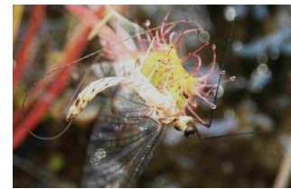
虫を捕えたモウセンゴケ