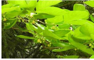
リュウキュウマメガキ?