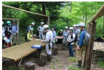
会の活動について説明