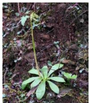
ツクシショウジョウバカマ