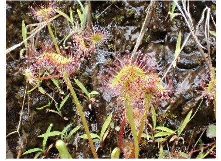
左からエゴノキ、ジャケツイバラ、モウセンゴケ