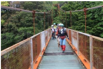
吊り橋を渡って島へ

ナラ枯れにより枯死したコナラや枯死木を伐採している状況、明るくなった林内にシカが食べない植物が増えてこれまでとは違った森に移り変わっている状況、ニホンシカによる食害と植生保護柵による生物多様性保全の取り組み、最近になって島に侵入してきたイノシシの影響などについて説明し、実際の状況をご覧いただきました。観察できた植物としては、実をつけて大きく育っているヒガンマムシグサ、シカが食べないために増えているアセビやシロダモ、ホテイチク林とタケノコ、ほかに一昨年まで営巣していたトビの巣などを見ていただきました。今回は、残念ながら？ヤマビルに出会うことはありませんでした。(福島)