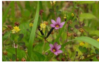
ニワゼキショウとコメツブツメクサ