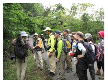
ウヅミザクラの実を観察