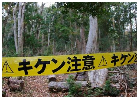
未整備地区には「キケン注意」の標識

なお、伐採を行ってみて分かったのは、去年の夏に枯れたコナラはすでに枝がもろくなっているということで、ほとんどかかり木になることなく伐倒できました。伐倒しやすい反面、伐採作業中の落枝や、伐採時の枝の飛散には十分な注意が必要です。反面、伐倒時の枝の飛散には十分な注意が必要です。また、幹も腐朽していることから、ツルを大きめにとって伐倒方向にチルホールで牽引して倒す方法が良いと思われます。牽引のためのロープを高い位置