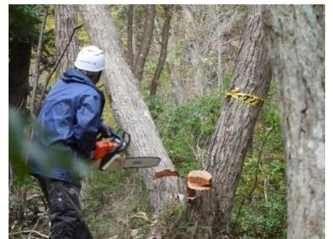
株立ちのコナラは1本ずつ伐採