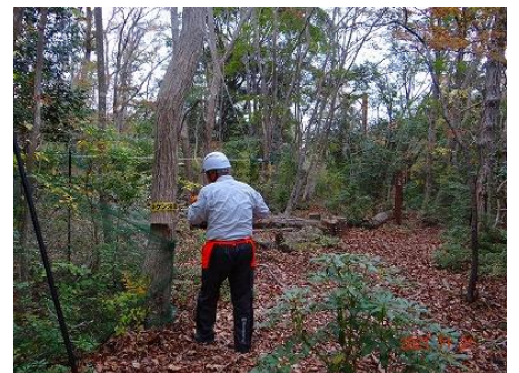
植生保護柵内のコナラはネットを壊さないように高い位置で伐採