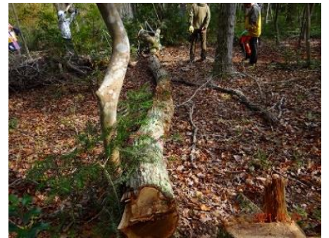
ナラ枯れにより腐朽しているためかかり木になりにくい