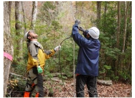
高い位置にロープをかけチルホールで牽引