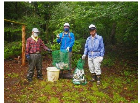
ホテイ岬の回収ごみいっぱい

シカ調査のあと、入江のまわりとホテイ岬でゴミ拾いを行いました。ビンやペットボトル、発泡スチロールなどのゴミのほか、ボートのモーターに使うようなバッテリーも捨てられていました。大きすぎてパスしたゴミもありましたが目立つゴミはほとんど回収できました。ゴミの回収と同時に、現在は使っていない植物保護のための亀甲金網も回収しました。(福島)