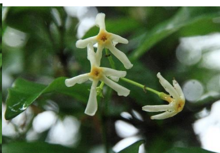
テイカカズラ(坂本)