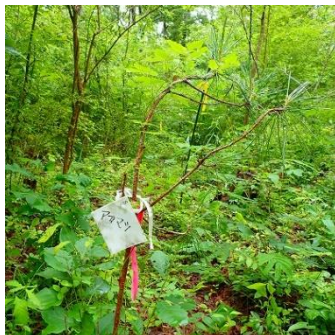
刈り出し後のコナラ伐採地

コナラ伐採地は刈りだし作業後、日差しがたっぷりと地面まで達したようです。枯葉で覆われていた裸地は見当たらず、隙間なく草本が生えていました。実生のコナラ、アカマツはより健康的に見えました。クロモジ、コバノガマズミ、サルトリイバラは果実をつけ、ムラサキシキブは花を咲かせていました。草本類優先区域にはヒメヤブラン、オカトラノオが咲きヤマユリの蕾が大きくなっていました。また、リンゴドクガの幼虫が鮮やかな白い衣装をまとったようで目を引きました。白い毛針には如何にも毒がありそうに見えますが図鑑には幼虫、成虫共に無毒だとありました。