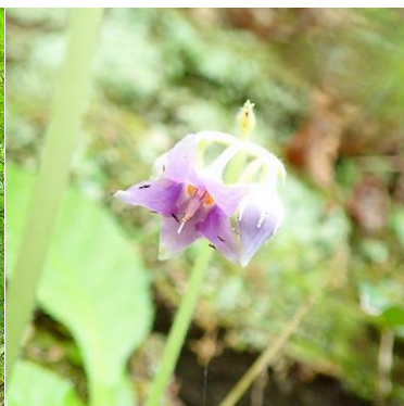
ケイワタバコ(秋元)