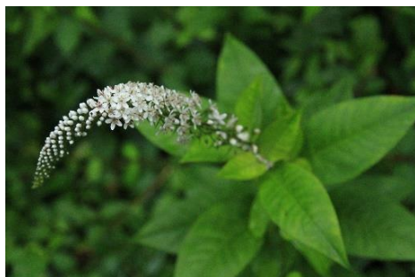
オコトラノオ(坂本)

改めて周囲を見渡すと、鹿が好むと考えられているアオキが生えており、他にもヤマユリ、ハリギリなど様々な植物が生えていました。きっとここは急すぎて鹿も来ない場所なのでしょうね。花も見られたし、何より無事に帰還できてよかった～。陸地からのアクセスが難しい場所は、今後は水辺からアクセスするのがいいかも。そろそろボートの出番かな？（成沢）