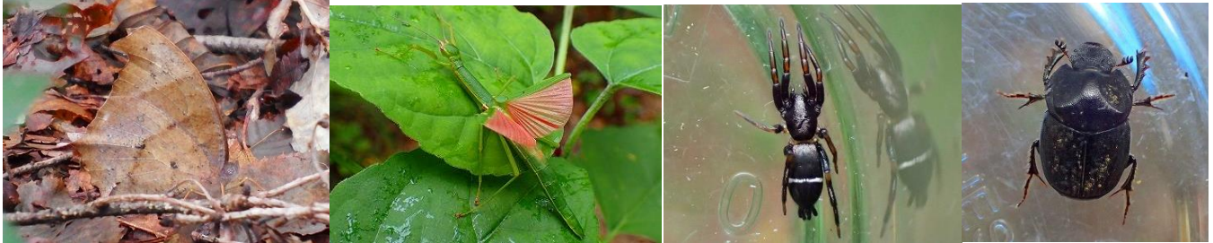
クロコノマチョウ

どんよりした曇り空、虫の姿はあまり見られません。今年は、長雨と猛暑の影響なのか、虫が少ないように感じられます。虫の声よりアマガエルの大きな鳴き声が森に響いていました。ピーティング(枝をたたいて虫を落とすこと)で虫を探しました。1~2 mm の小さなクモが多いこと！同定が難しく、名前がわからないものもいます。ヒトオビトンビグモ(ワシグモの仲間)は、以前、竹の中にいたクモで、なつかしい再会です。時々ムカデやスズメバチも落ちるので、ちょっとスリルのある虫探しです。キタキチョウは明るい所を、クロコノマチョウは薄暗い所を飛んでいました。枯れ葉そっくりなクロコノマチョウは、枯れ葉に止まると見つけるのは至難の業、まさに忍法隠れ蓑術！どちらも成虫で越冬します。