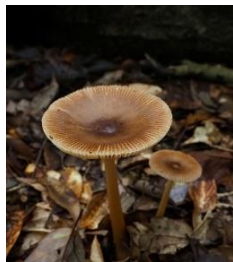
カバイロツルタケ