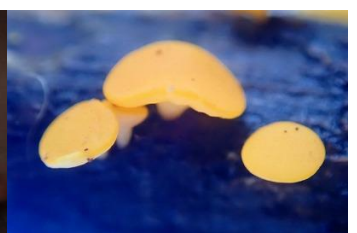
ビョウタケの仲間