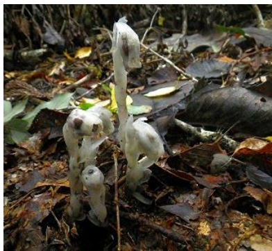
アキノギンリョウソウ