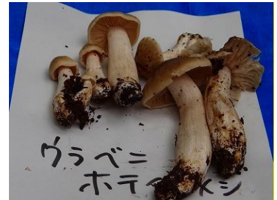
ウラベニホテイシメジ