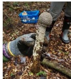
ハイカグラテングタケ