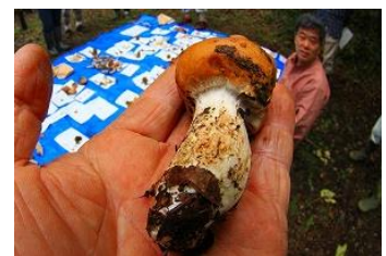
フウセンタケの仲間