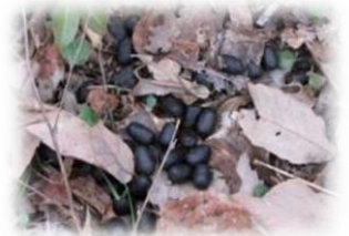
フレッシュなシカのフン

これからも油断はできませんね。植生を保護するためには、もっと丈夫なネットに交換する必要があるかもしれません。