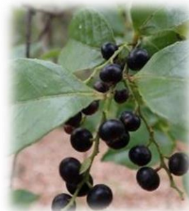
シャシャンボの実(栗山 12月)