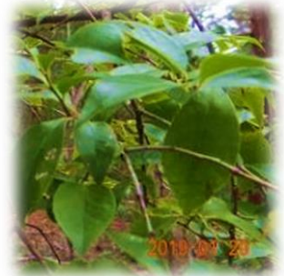
実のないシャシャンボ(1月)