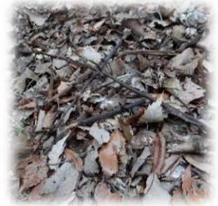
ツチアケビの残骸 1月20日