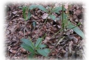
食害を受けたミヤマシキミ