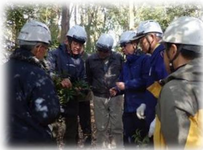
サカキ(榊)かヒサカキか同定