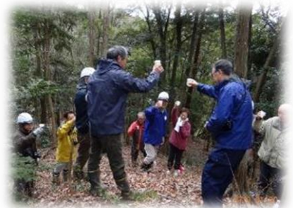
お供えの「梅一輪」で安全祈願の乾杯