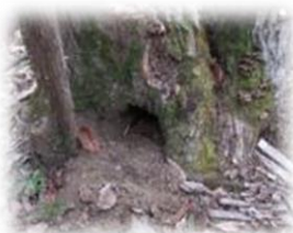
腐った切り株の根元を掘った跡