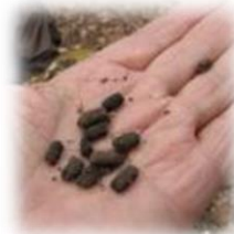
切り株の根元に落ちていた糞