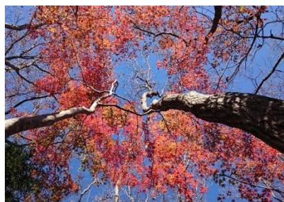
見上げれば紅葉と青空