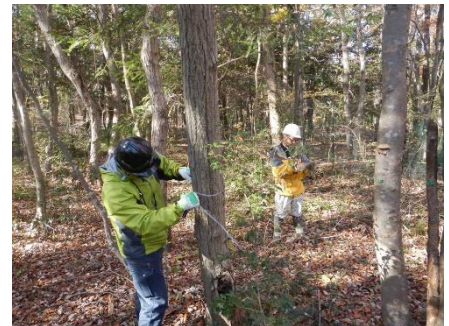
胸高直径を測定中～

シカの調査のあと、巨木林エリアの植生保護柵で囲まれた20m×20mの調査地で樹木の成長調査を行いました。この調査は、2008年12月から毎年この時期に行っており、今回が10回目の調査になります。今回のデータはこれから集計しますが、前回の2016年までの調査で、調査本数が70本から62本に減少したものの、蓄積は7.3m 3 から9.1m 3 に24%増加していることがわかりました。2016年時のヘクタールあたり蓄積は227m 3 、成長は、モミ、コナラ、サクラ類の直径が大きいものほど大きい傾向にあり、直径が小さいものはほとんど成長していませんでした。（福島）