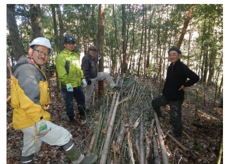
稈と枝葉は分けましょうね♪