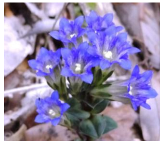
フデリンドウ 4/19 真鍋