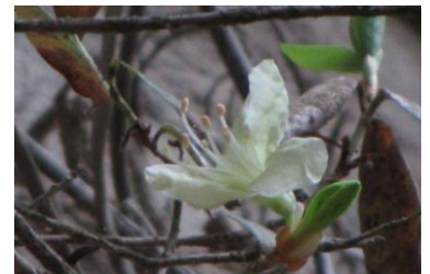
ヒカゲツツジ 4/19 福島