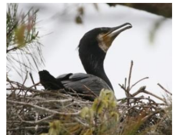
カワウの巣 4/15 坂本

複数のカワウの巣では合わせて5羽の雛が見え、抱卵中の巣もありますからもっと増えると思います。巣箱からシジュウカラが飛び出したとの目撃情報もあり、繁殖に利用されているようですからまさに豊英島はベビーブームです。ホテイ岬の対岸からは夏の渡り鳥、オオルリ、センダイムシクイ囀りも聞こえました。(坂本)