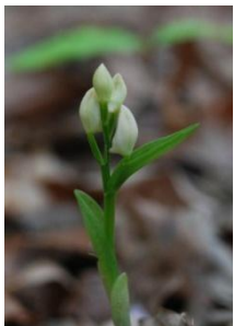
ユウシュンラン 4/19 福島

昨年4月に種確認されたユウシュンランが巨木林エリアに多数株開花していました。昨年の自生エリアのほかヒメフタバラン斜面などにも見つかり、豊英島には広範囲に自生していることがわかりました。昨年の花のピークは4月29日でしたが、今年は開花が10日程早いようです。(真鍋)