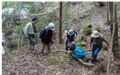
禁断の岬崖下の植物観察

ヒメフタバランを観察した場所で崖を見上げると、ヒカゲツツジの花がひとつだけ咲いていました。崖に辛うじて残った株は弱っているように見えたが、新芽も出ていたことから復活に期待したいと思います。(福島)