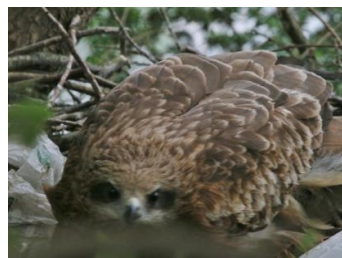
雛を護るトビ 4/19 坂本

トビの巣には3羽の雛が誕生していました。雨模様の時には親鳥が覆いかぶさって保温と雨除けをしていました。森進一の歌うおふくろさんの歌詞にある通り「雨の降る日は傘に一なりー」です。