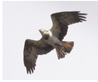
ミサゴ 12/14 吉澤