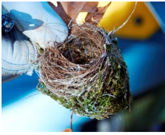
メジロの巣 12/14 吉澤