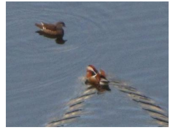
オシドリ 12/14 福島

12月13日記録に14日の福島記録を加えた記録です。(12/13 坂本+12/14 福島)