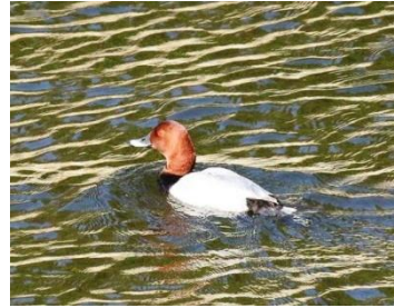
ホシハジロ 12/13 坂本