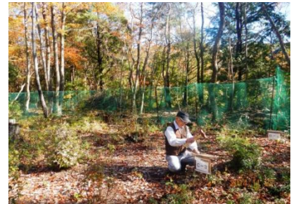
関東一遅い紅葉は丁度見ごろでした

第1回で早くも計112種類の出現が確認されました。十分な光が当たることから、多くの草本とともに、アカメガシワ、カラスザンショウなどの先駆種や、萌芽のコナラ、ヤマボウシ等が目立ちました。今後、多くの会員がそれぞれの得意を生かして参加できるよう、調査方法そのものも試行錯誤を重ねて固めていきたいと思います。(事務局)