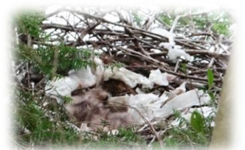
この産毛は雛? 4月29日真鍋

トビの巣には雛が誕生していました。羽数は不明ですが2羽か3羽のようです。巣は新しい場所に今春新たに営巣されたものです。雛が巣立つまで親を刺激しないよう静かにお願いします。