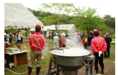
清和ミツバツツジ祭り

参加者は市が用意した苗木100本を所定の場所に手植えし、お土産に配られた苗木を持ち帰りました。最終的には10万本の植樹をして日本一のミツバツツジの里づくりが目標だそうです。千年の森のリーフレットは受付デスクに置かせてもらい、参加者に手渡してもらいました。祭り主催者からの配布物は何も無かったので当会のリーフレットに目を通しての人が多くみられました。会員増につながることを期待します。(坂本)