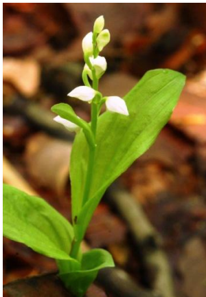
ギンラン 5月1日