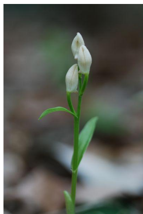
ユウシュンラン4月29日 福島

ユウシュンラン Cephalanthera erecta var. subaphylla ギンランの変種、緑葉がほとんどなく菌根依存性が高いとされている。環境省絶滅危惧Ⅱ類指定、37都道府県で絶滅危惧指定されているが、千葉県では自生が確認されていなかったため未指定。天野・大山による東大演習林での2012年5月自生確認がユウシュラン千葉県第1号で、豊英島は2番目の確認になりますが、豊英島では07年-09年ユウシュランの画像が「ギンラン」として記録されているので、実質的には豊英島が千葉県での自生確認第1号かもしれません。