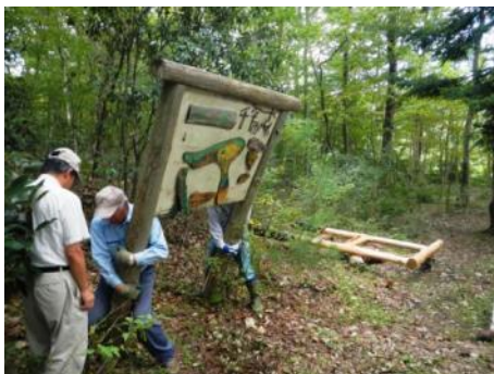
旧案内板を撤去し

古い案内板の撤去作業後、建て位置を決め、穴掘り、柱枠組、案内板張り付け作業等少ない人数でしたが、和気あいあいと建て終わり、案内板の前で記念撮影をしました。(根本)