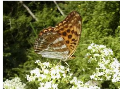
ミドリヒョウモン♀

チコガネとの出会いはうれしい。ダム湖の周辺ではノシメトンボなどのアカトンボ類がたくさんいた。そろそろ高山で過ごしたアキアカネが下りてくるころだが、越夏組のメスを見かけただけ。(文・写真とも田島さん) (他に観察された昆虫) キタキチョウ、コムスジ、ヒメジャノメ、チャバネセセリ、ギンヤンマ、ウスバキトンボ、ナツアカネ、オオアイトトンボ、ノコギリクワガタ、オオアトボシアオゴミムシ、コキベリアオゴミムシ、オオモンシロナガカメムシ、ツクツクボウシ、アオバハゴロモ、クロスズメバチ、ヒメスズメバチ、フタスジスズバチ、キンケハラナガツチバチ、スキバツリアブ、アオマツムシ、ヒシバッタ sp、カネタタキ、ヤマトシリ