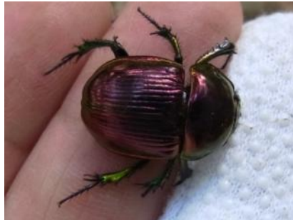
オオセンチコガネ