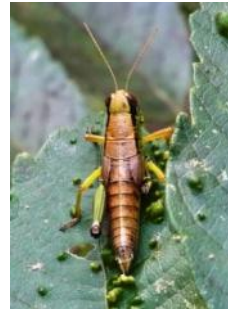
タンザワフキバッタ