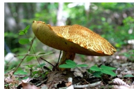
アカヤマドリ(坂本):夏のキノコも楽しみ