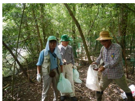
水辺清掃(ホテイ岬)