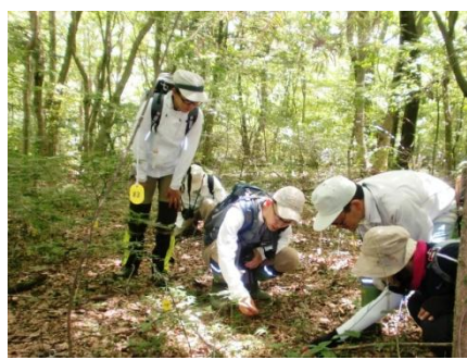
多数のクロムヨウランに魅せられて