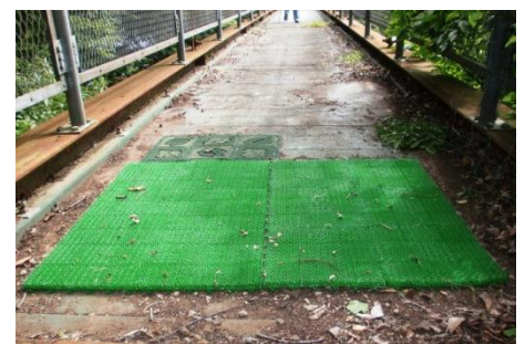
島入口の人工芝玄関マット