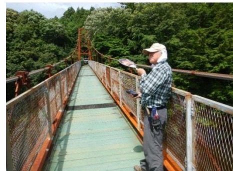
相対照度調査(橋の上は100%)