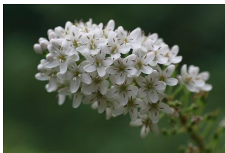
オカトラノオ(坂本)