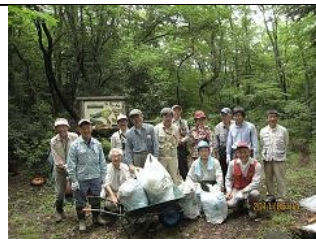
集めたゴミと記念写真