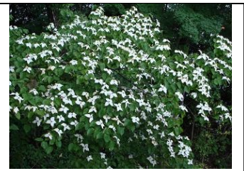
満開のヤマボウシ