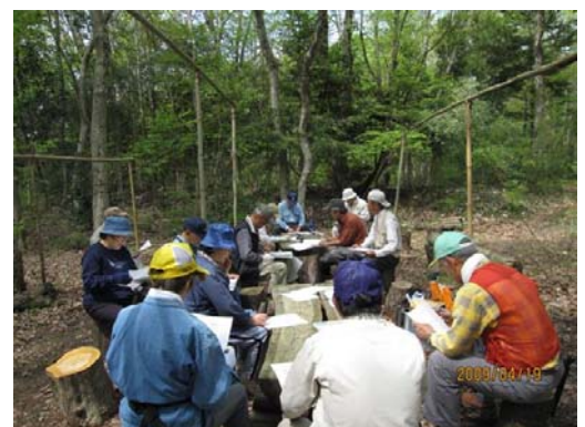
快晴の清々しい新緑の森で年次総会