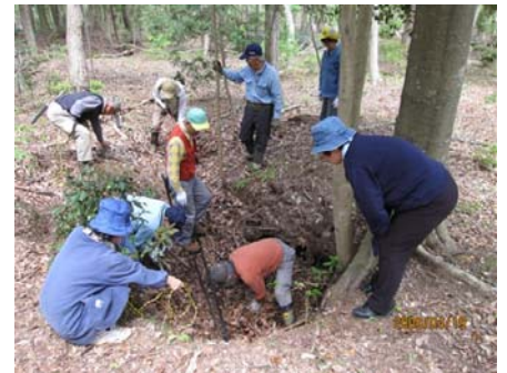
大勢で交代の井戸堀りに活気づく

井戸の構造は、地下3～4mにある不透水層（岩の層）まで掘り込んだ穴に、上部の土砂の層から染み出した水がたまるタイプと思われます。久留里城の頂上直下にある男井戸（おいど）、女井戸（めいど）と同じものと思われる。（伊藤記）