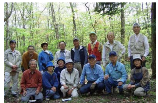
年度初めの活動日に新会員二人を迎えて

○シイタケ収穫；前回収穫から2週間経過し、気温上がり雨もあったせいか、シイタケは大型厚肉で収量約6㌦、サルの食害なく、保護ネット外のホダ木も無傷でした。昼食時に皆で存分に賞味し、お土産に持ち帰って美味しく頂きました。森の恵みに感謝。