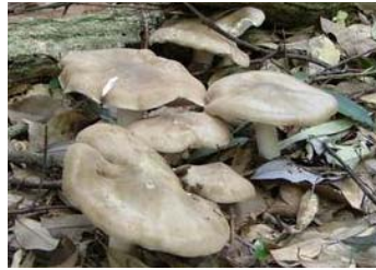
ウラベニホテイシメジ