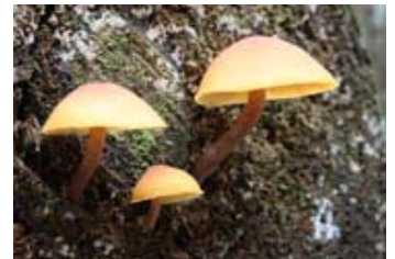
チャツムタケ属の未同定種