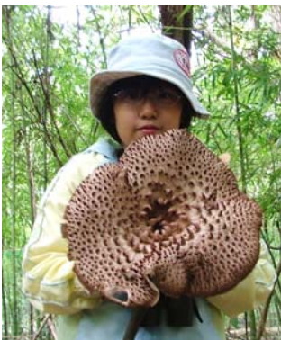
顔よりも大きなコウタケ

私は今まで大分の「夢の大橋」しかわったことがありませんでした。でも今日わったつり橋は「夢の大橋」よりも大きくゆれてこわかったです。